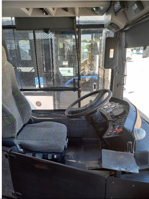
AUTOBUS MAN A 76 MIEJSKI NGI 23436”.