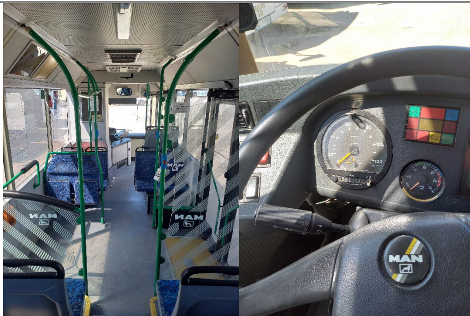
AUTOBUS MAN HOCL MIEJSKI NGI 19586”.